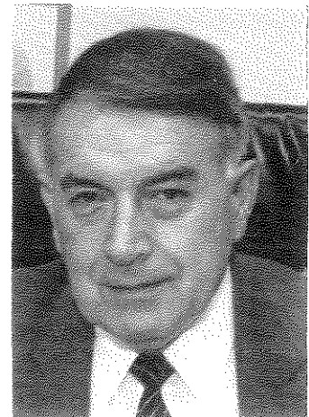
פרופ' יאן י. קלרמן

צהריים, ערב וחצות, ואחר כך כל שעה, ואחר כך כל עשרים דקות. עכשיו יש לנו כבר גל פתוח לחדשות. החדשות הן אופיום ואפשר להתמכר אליהן. אי אפשר להיגמל מהן בעצמנו; צריך לעזור לנו להיגמל מהן. אם צריכה לצאת מכאן איזו קריאה, הקריאה שלי פשוטה — תנו לנו חדשות ברמה מקצועית יותר גבוהה: יותר מדוייקות, יותר עמוקות, יותר נייטרליות. תנו לנו חדשות ברמה תרבותית יותר גבוהה, בסגנון יותר מתקבל על הדעת, עם שורשים תרבותיים יותר מתקבלים על הדעת. ובכלל, תנו לנו פחות חדשות!