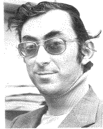
פרופ' אסא כשר

העתונות היא משקפי אישון. האישון הזה, שיושב פה על הזוגיות שלי משנה כל הזמן את העדשות. משנה את שדה הראייה, לרוחב ולעומק. משנה את הכיוון, ואת הצבע, ומה לא? — אבל אין מנוס מכך. מפני שזאת אשליה, שהעולם הוא קבוצה אוטונומית נייטרלית של חדרות, שרק צריך לשלוח שליחים שיביאו אותן. החדשות כשלעצמן אינן כהישג ידני, מפני שאין "חדשות כשלעצמן". אני מוכן להגיד זאת בצורה קיצונית כלשהו, אבל צורה שאני מתייחס אליה ברצינות: