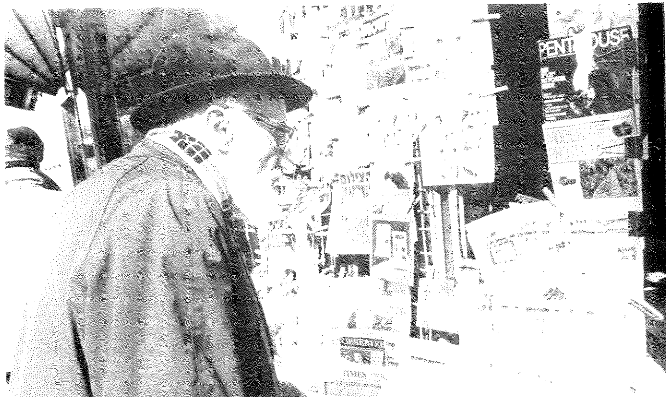
חברת השפע (מבחינת מינוון העתונות)

פקודת העתונות קובעת, כי "שר הפנים רשאי להורות על הפסקת הופעתו של עתון אם מפרסם עתון ידיעות שקר או שמועות שקר שיש בהן כדי לעורר בהלה או ייאוש." שוב, הדגש הוא על שקריותן של הידיעות או השמועות וזרעות הבהלה והייאוש. בפסק הדין שהזכרתי קודם, בפרשת אולפני הסרטה לישראל נגד המועצה לביקורת סרטים ומחזות, ביקשה המועצה לאסור הקנתו ברבים של יומן קולנוע, שתיאר אירוע אלים של פינוי בכוח, בעזרת המשטרה, של דיירים שפלטו למבנה לא להם. נימוקה של המועצה היה, שאין להראות את היומן משום שהוא פוגע בטעם הטוב. בפרפרזה הלקוחה מכותרתו של רב השיח הזה אפשר לומר, שהמועצה לביקורת סרטים ומחזות סברה כי יש לפסול הקרנתן של "חדשות רעות", העלולות לפגוע ברגשותיו של הציבור. בדחתו נימוק