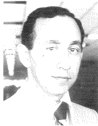
פרופ' שלמה ברזניץ

אנו יודעים, שכשמדובר על לחץ פסיכולוגי, על לחץ נפשי, זה תמיד בגלל אינפורמציה. אין שום דבר אחר שיוצר לחץ נפשי, זולת אינפורמציה. אינפורמציה על מה שהיה, אינפורמציה על מה שהוזה, וביחוד אינפורמציה על מה שעלול להיות בעתיד. לפיכך, היכולת שלנו לחזות מאורעות מסויימים, ביחוד אם הם שליליים, גורמת לכך שהם משפיעים עלינו לפעמים ימים, שבועות, חודשים או שנים לפני שהם מתרחשים. היום אפשר להיכנס לבתי ספר, ולראות כבר בגיל די מוקדם